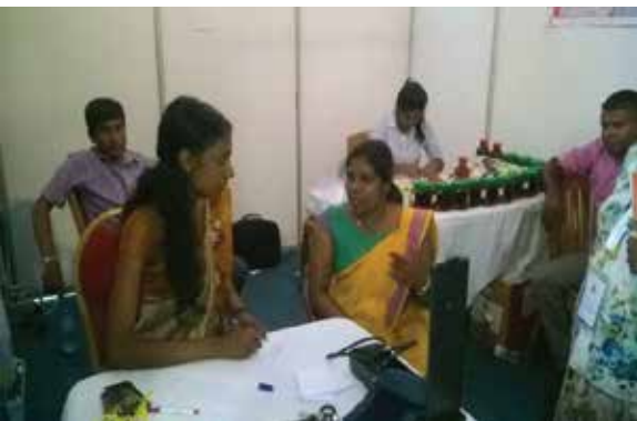
மொணறாகல Vision 2020

முதல் Vision 2020 அபிவிருத்தி நிகழ்ச்சித் திட்டம் மொணறாகலயில் நடத்தப்பட்டதுடன், ஹோமியோபதி மருத்துவமனையின் ஊடாக இதன் கண்காட்சிக் கூடமொன்று ஒழுங்கு செய்யப்பட்டதுடன் 372 நோயாளிகளுக்கு சிகிச்சைகளும் வழங்கப்பட்டன.