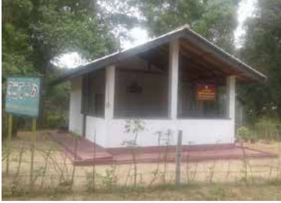
கனேவத்த பேணர்சபைக் கட்டடம்

❖2017 ஆண்டின் ஒதுக்கீட்டின் அடிப்படையில் உற்பத்தி செய்யப்பட்ட 19 மருந்து உற்பத்தி உபகரணங்கள் உரிய பிரதேச செயலகங்களுக்கு எடுத்துச் சென்றமைக்காக 140041.84 போக்குவரத்துச் செலவுகள் செய்யப்பட்டன.