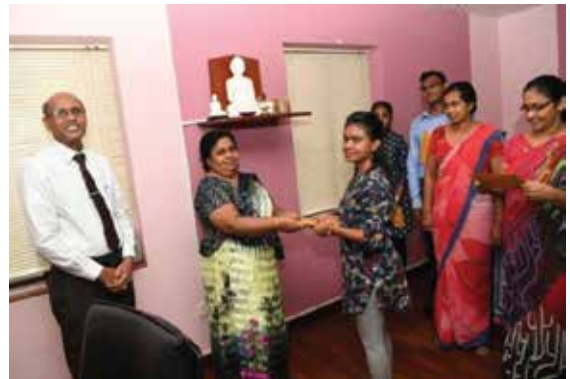
பட்டத்தைப் பெற்றுவந்த மருத்துவர்களுக்கு நியமனத்தை வழங்குதல்